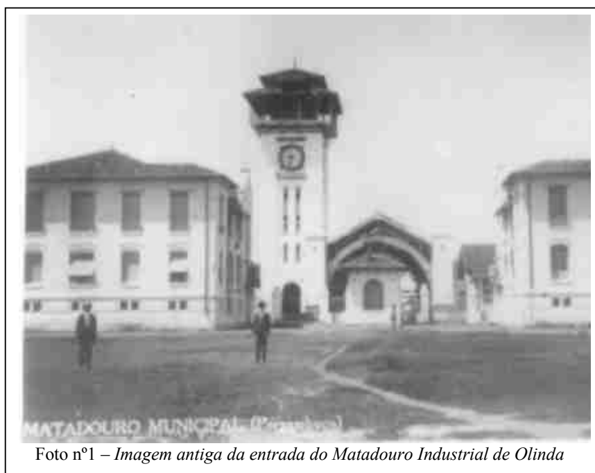
Foto nº1 – Imagem antiga da entrada do Matadouro Industrial de Olinda

Em 1970, o Matadouro encerrava suas atividades, o mesmo ocorrendo com o Curtume, que não teria mais onde comprar o couro. Além do valor econômico que esse empreendimento representava para a comunidade, já que a maioria dos trabalhadores morava no bairro, o Antigo Matadouro também tinha um valor simbólico muito forte por ter sido o responsável pelo crescimento do bairro. Esta era uma atividade importante para o Estado de Pernambuco e também simbolizava o progresso do bairro.