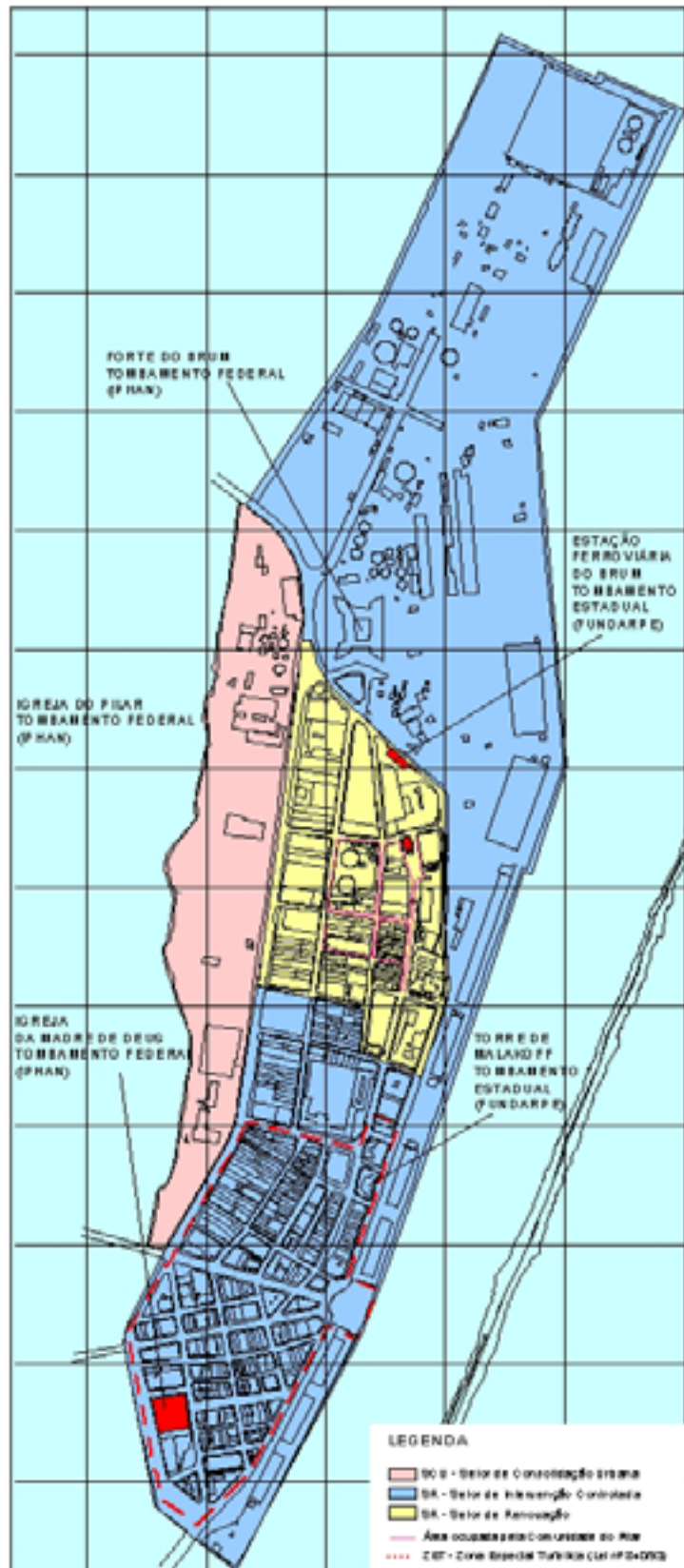
SETORES, MONUMENTOS E ÁREA TOMBADOS E ÁREA OCUPADA PELA COMUNIDADE DO PILAR