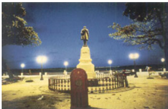
Figura 07 - Praça Rio Branco antes da reforma