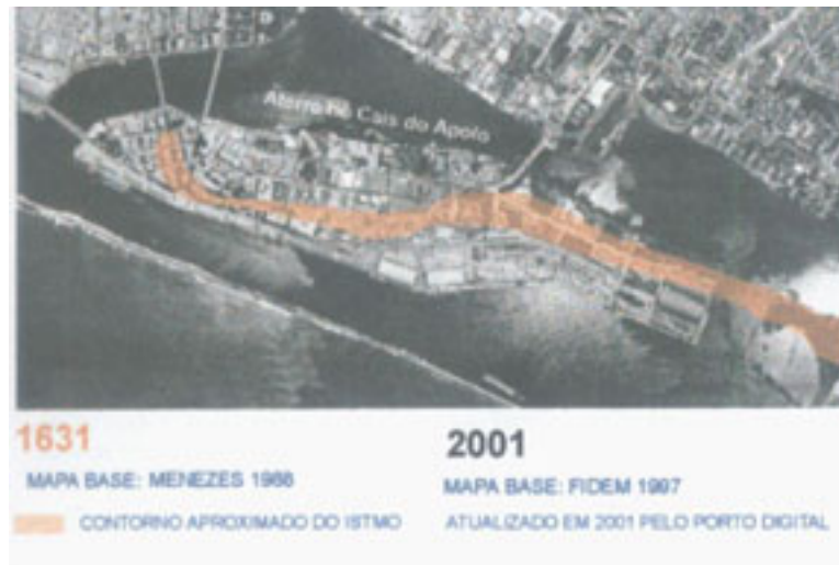
Figura 06 – Bairro do Recife em 1631 e em 2001.