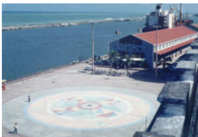
Foto 05 – Praça Rio Branco com Terminal Marítimo de Passageiros ao Fundo em 2002

A praça foi propositalmente transformada em local para grandes eventos e festividades que movimentam quase que mensalmente o Bairro do Recife (Foto 05). Inesperadamente tornou-se palco de manifestações políticas, a exemplo da ampla comemoração da eleição do Prefeito João Paulo, do Partido dos Trabalhadores, no fim de 2000, e da vitória do Presidente Lula, em 2002, a ponto de a praça passar a ser chamada por muitos de Marco Treze. Além de ser ponto de convergência e de parada para se fazer protestos, como contra a violência, e reivindicações, como a salarial.