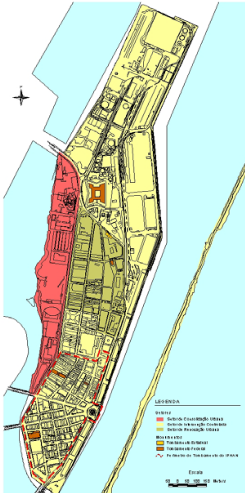
SETORES, MONUMENTOS E ÁREA TOMBADOS