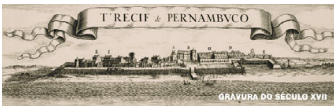
Figura 05 – Povo dos Arrecifes

Em 1630, a concretização da invasão holandesa marcou o início de uma nova época para o povo da aldeia, a essa altura já chamada de Recife (Sette, 1978:29). O interesse dos holandeses pelas terras e riquezas brasileiras e o porto natural existente, na época a serviço da indústria açucareira, fez com que se instalasse nessa região a capital do império holandês no Brasil. O Conde Maurício de Nassau, representante da Companhia das Índias Ocidentais, não escolheu o Porto dos Navios para habitar devido às dificuldades naturais impostas. Preferiu se instalar na Ilha de Antônio Vaz, cercada de mangues e rios, com a intenção de transformá-la em cidade, passando a chamá-la de Cidade Maurícia. Com o palácio sede do império instalado onde hoje são os bairros de Santo Antônio e São José, Nassau deu início a grandes reformas em toda a área primitiva do que viria a ser a Cidade do Recife.