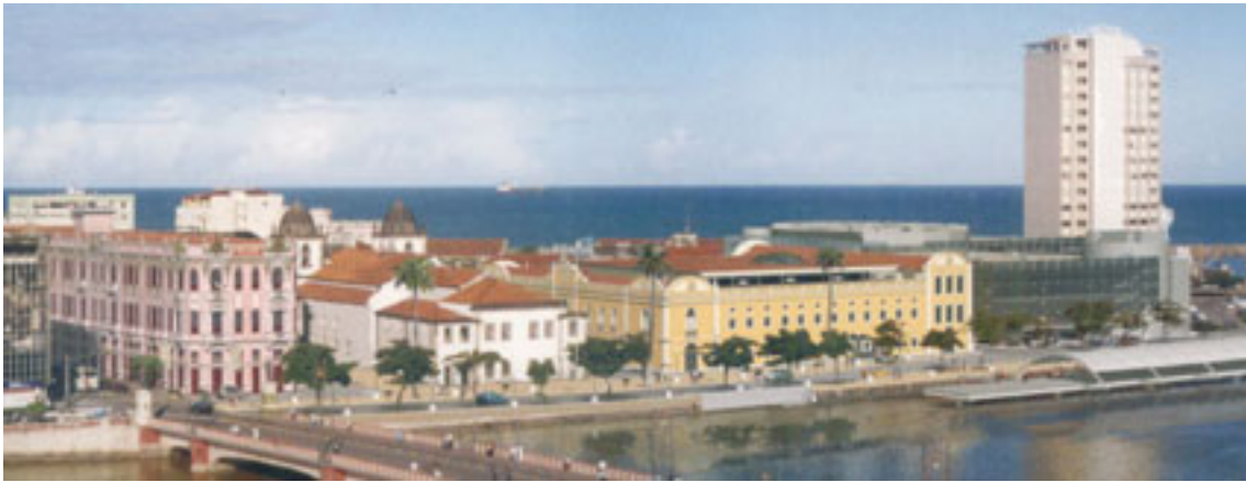
Figura 03 - Complexo Paço Alfândega após sua conclusão. O Prédio cor de rosa é o Chanteclair, o branco é a Igreja Madre Deus e o amarelo, o Shopping Paço Alfândega.

Com a inauguração dos empreendimentos e através de intervenções nos espaços públicos, ruas restauradas com paralelepípedos à mostra e calçadas alargadas, espera-se uma requalificação do ambiente, um “redescobrimento” da área, o que acabará por influenciar a mudança do público freqüentador da área: