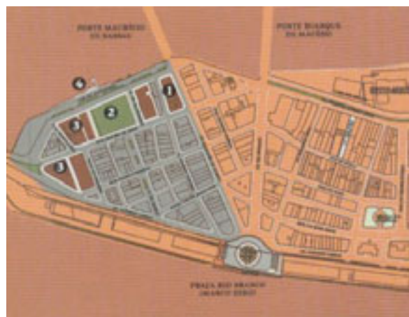
Figura 02 – Localização dos edifícios do Complexo Paço Alfândega.

Para a inauguração do Chanteclair está previsto um prazo de doze meses, após o início da reforma. Neste edifício será instalado um centro de entretenimento com salas de cinema voltadas para filmes de arte, bares, um café-concerto, além de um teatro.