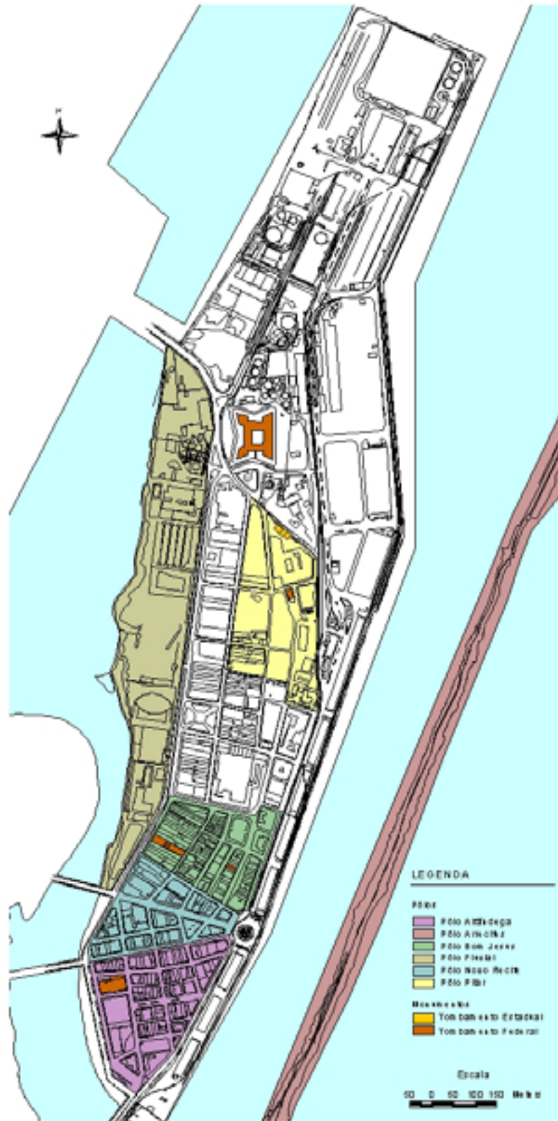
PÓLOS DE INTERESSE E MONUMENTOS TOMBADOS