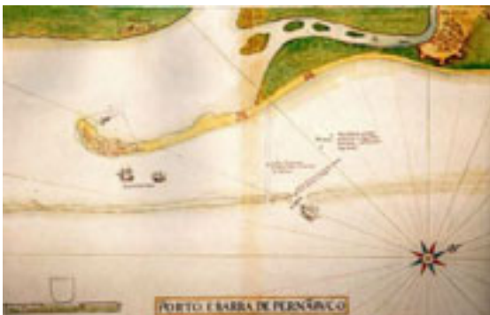
Figura 04 - Bairro do Recife/Séc. XVII.

"Apenas o 'Povo'. O rio vinha contornando o istmo, juntava-se ao que descia suas águas pelos mangues do sul, e, reunidos, investiam o oceano na boca chamada pelos selvagens de 'paranambuco'... De assalto, quase sempre, as vagas golpeavam a murada dos arrecifes, cresciam num tapume de espumas, tombavam de supetão molhando pedras plantadas por Deus para darem abrigo e nome a uma cidade cujo destino andava ainda distante de se prometer." (Sette, 1978:27)