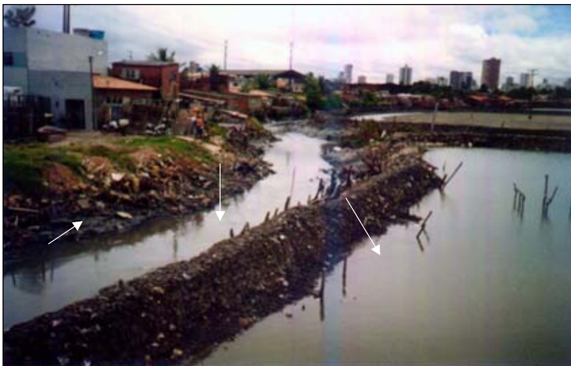
Foto 08: Por ordem das setas: avanço dos aterros (lado esquerdo), estreitamento da maré (centro) e viveiros (direita).

Assim, os viveiros foram sendo achatados em direção à parte detrás dos assentamentos, o mangue quase inexistente, e a maré vem sendo cada vez mais engolida pelos sucessivos aterros 25 que estão acontecendo com bastante frequência e com fins de propiciar moradia para alguns, expandir a casa ou quintal de outros, bem como para alojar empresas e oficinas nessa área.