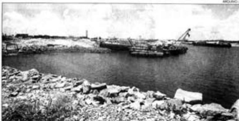
PROJETO O Complexo Portuário de Suape será ampliado e, por isso, o Estado determinou a retirada de mata