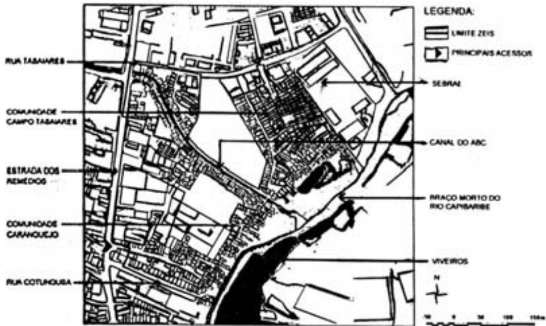
Mapa 1: Limites da ZEIS Caranguejo/Campo Tabaiars e seus principais acessos.

separados pelo canal do ABC, localizados na cidade do Recife e instituídos como uma única Zona Especial de Interesse Social (ZEIS) 2 a partir de um processo de organização da população local com o apoio da igreja, cuja pressão social, em meados de 1970, conseguiu a liberação da permanência da população no local pela prefeitura.