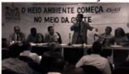
Ilha do Zeca foi tema de Audiência Pública na Câmara Municipal do Recife