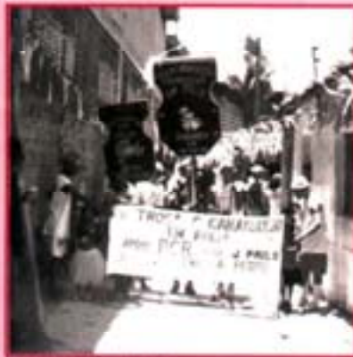
Saída da Troça de comunidade

Parabéns, Caranguejo Tabaiaries, você é uma comunidade participativa e, por isso, tem lideranças comprometidas com a cidadania!