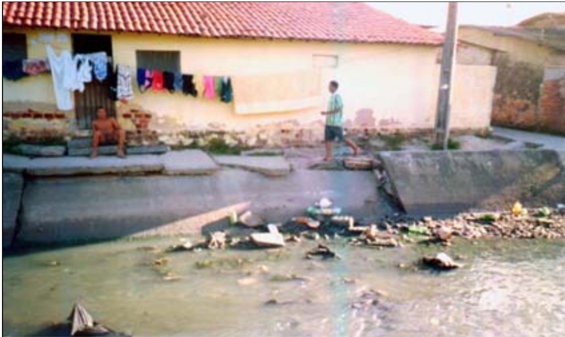
Foto 05 22 : Imagem de uma parte do canal que está caindo e da casa que está ameaçada.

“(...) antigamente as casa era tudo de barro, de taipa coberta com palha, de zinco, hoje as casa já tão... são saneada, são casas que tem banheiro porque antigamente não tinha banheiro. Hoje são umas casa melhor, mesmo sendo muito precário, porque nem todo mundo pode ter um barraco, mas eu vejo as casa melhor que antigamente(...) esse canal nosso aqui, é um canal que realmente não dá muito desespero à comunidade, porque é um canal que não transborda né, só o que tem um pouco aqui são os inseto, as muriçoca, rato que vem muito através do canal. Isso é (...) o que incomoda mais a comunidade”. (Seu Paulo)