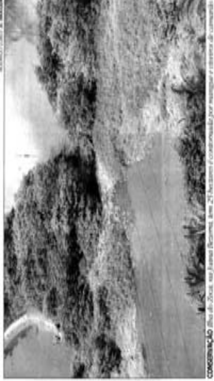
RECIFE/RECIFE E MANOEL

No link da Diretoria de Meio Ambiente (Dema) é possível, ainda, consultar a relação dos locais de preservação de Áreas Verdes do Recife (PAV), dos árvores nativas e das áreas protegidas. Há dados e imagens de satélite de cada uma delas. A Dema disponibiliza também informações sobre o Jardim Botânico do Recife, como uma lista dos espécies do município do lugar e das mudas de 154 espécies de plantas produzidas na secretaria.