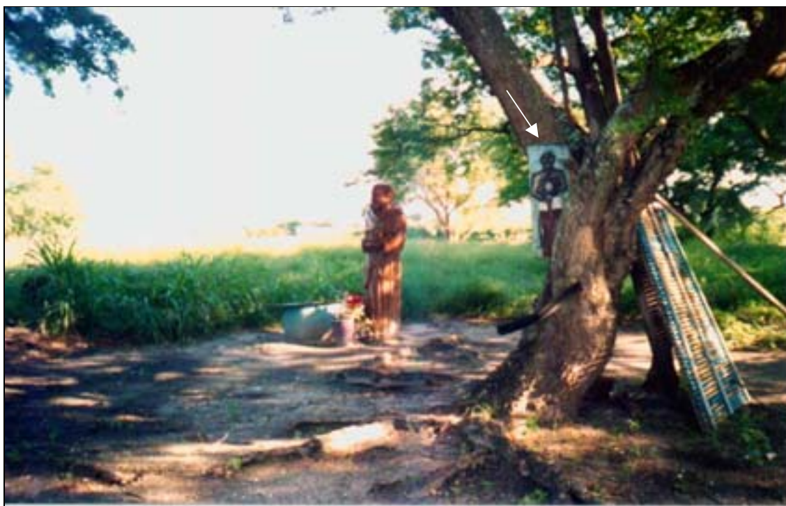
Foto 10: Imagem expondo o sincretismo religioso (imagem do São Francisco e a imagem de um negro e/ou divindade pendurada na árvore)

Gostaria de registrar também o sincretismo que já vem existindo no local, expresso na presença da imagem de um negro e/ou divindade afro-brasileira, com algo na mão, pendurado na árvore, e de algumas carrancas próximas, geralmente símbolo comum em ambiente de pesca.