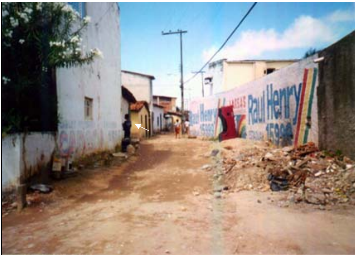
Foto01 7 : Principal rua de acesso aos assentamentos

Ao se chegar à comunidade – entrando pela rua Tabaiães – a visão inicial é uma rua de terra entrecortada por becos que formam algo semelhante a labirintos, nos quais se distribuem as famílias de Tabaiães.