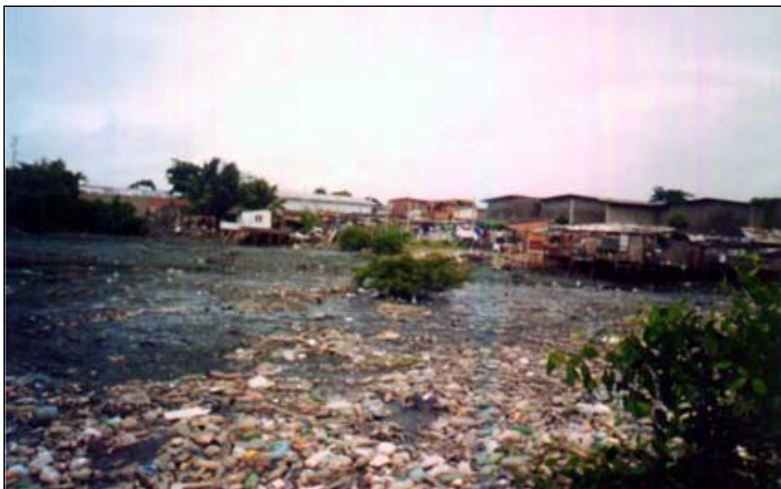
Foto 02: Maré seca, lixo entulhado, resquícios de mangue e os aterros ao fundo.

Quanto à função social do velho estar atrelada à questão da tradição, em um dos dias de pesquisa em campo pude entrevistar um dos moradores mais antigos de Caranguejo e Campo Tabaiães, que é também ex-presidente da associação dos moradores e, hoje, atual presidente da troça carnavalesca Caranguejo em folia . Nessa entrevista, o que ficou muito presente foi sua desenvoltura de expressão, bem como a utilização da palavra Tradição para expressar a identidade 19 de sua comunidade e, por assim dizer, de sua própria identidade.